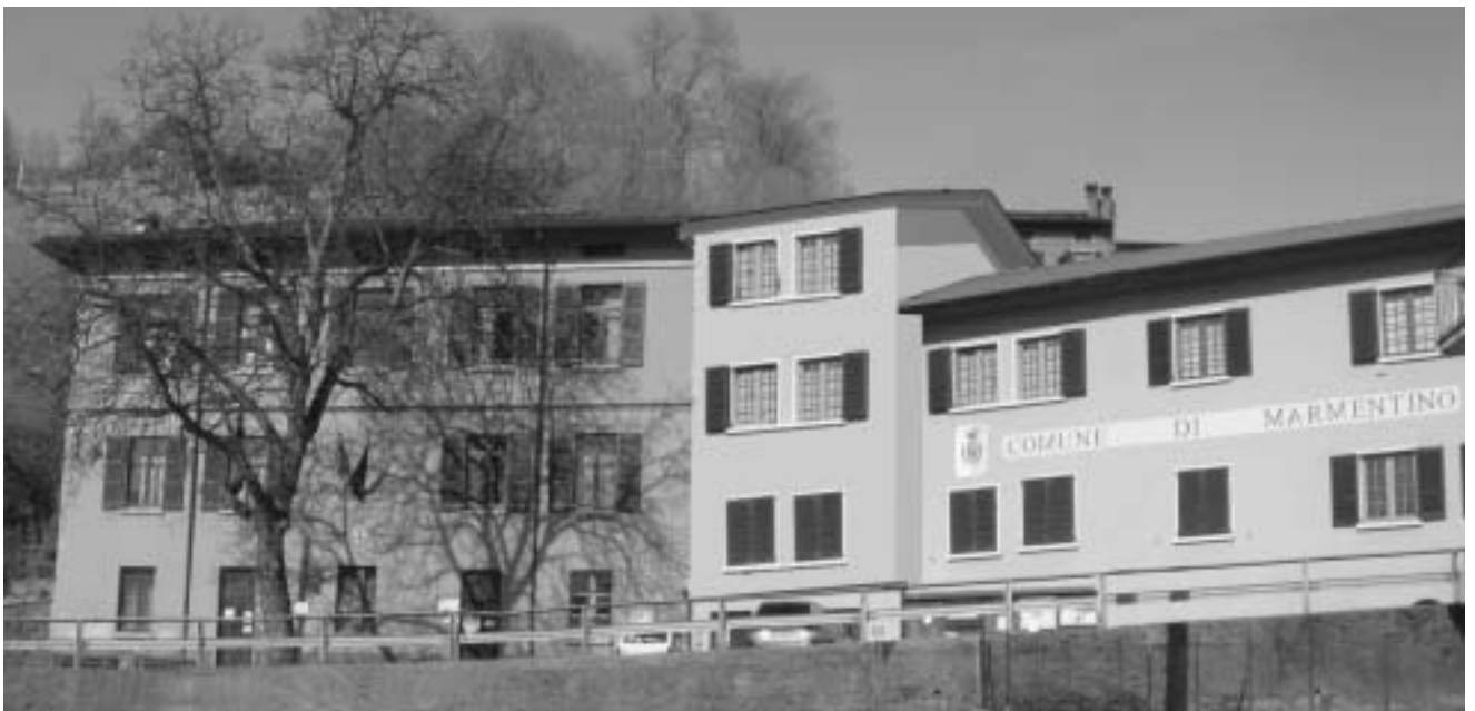
Nella parte centrale della foto la nuova struttura in progetto di realizzazione